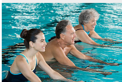
Espace Aquabike / Cardio training / Circuit aqua