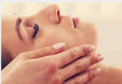
Espace Beauté - Sérénité