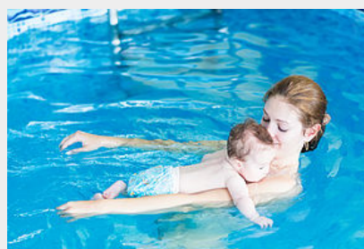
Bébés nageurs et natation enfants