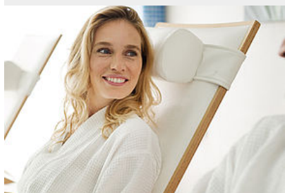
Séjours au spa